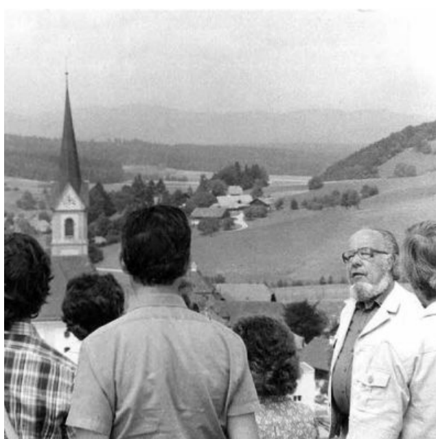
«Seppi a de Wiggere», der Vermittler. Hier gibt er der Zuhörerschaft viel Wissenwertes über Pfaffnau preis.

Eingeladen zu diesem Gedenk Anlass sind alle, die Interesse am Werk von «Seppi a de Wiggere» haben und natürlich auch alle Seppis, Josephs, Guiseppes und auch Giusseps/Gioschs. Um 17 Uhr endet die Veranstaltung im «Kreuz»-Saal. Wer weiter den Austausch pflegen will, kann dies gerne in der Gaststube tun. pd