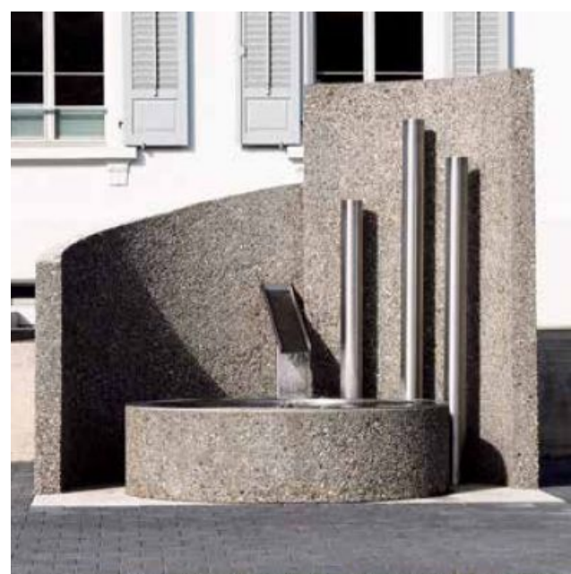
«Seppi a de Wiggere»-Brunnen: Diese Gedenkstätte wurde anlässlich des 100. Geburtstags 2014 eingeweiht.